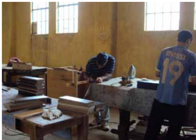
Participantes del taller de carpintería dentro del penal.